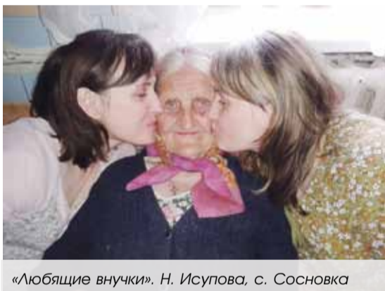
«Любящие внучки». Н. Исупова, с. Сосновка