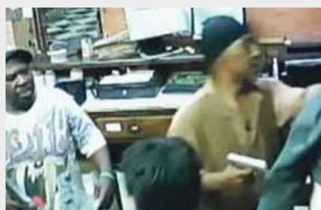
Фото с камеры наблюдения

Два пожилых американца совершили вооружённое ограбление одной из Чикагских клиник. Добычей преступников стали 56 пачек виагры и ноутбук. Общая стоимость похищенного — свыше двух тысяч долларов. Необычных грабителей зафиксировала камера, судя по видеосъёмке, это мужчины старше 60 лет. Сейчас они объявлены в розыск.