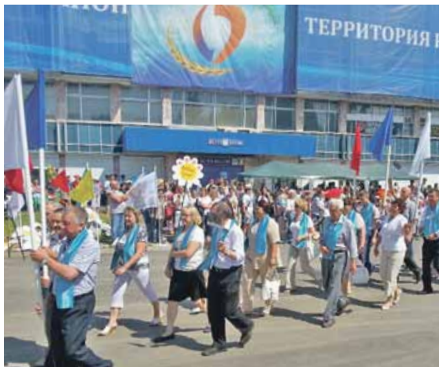
Колонна райпотребсоюза на юбилей Новосибирского района