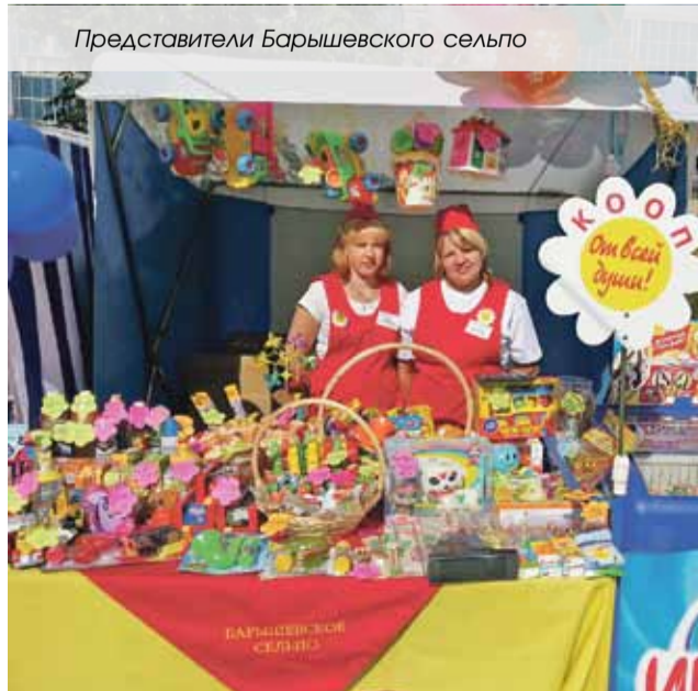
Представители Барышевского сельпо