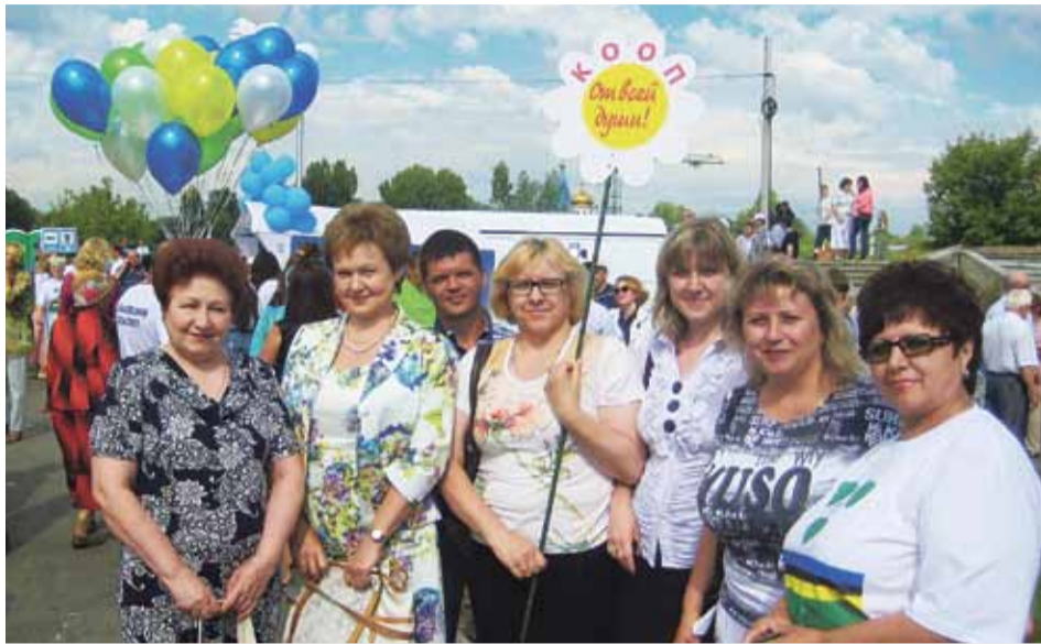
Кооператоры на юбилей Новосибирского района

Другое дело — глубинка, сетевые туда не придут. Тогда уже конкурентоспособным преимуществом становится харизма работника торговли.