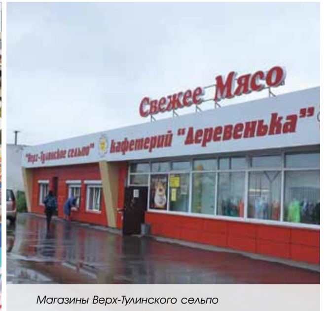
Магазины Верх-Тулинского сельпо